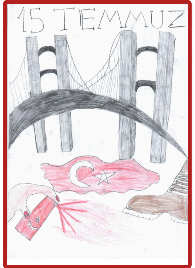
Ekin Eylem Dağlı 8/A