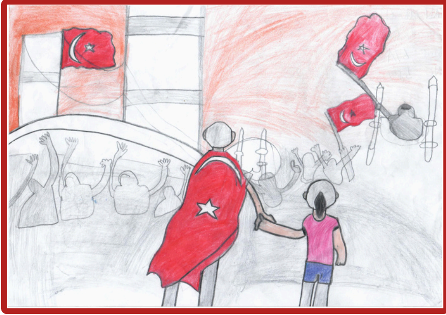
Ahmet Eskiocak 7/A