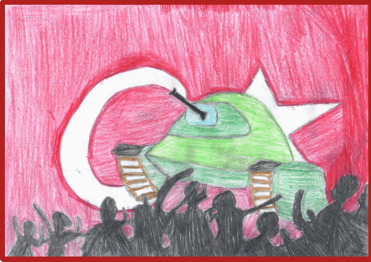
Irmak Sarıoğlu 7/A