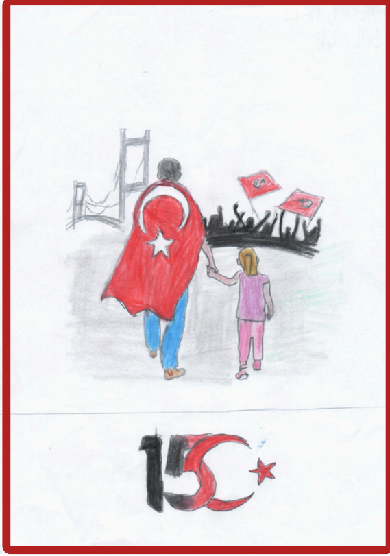
Altay Deli 7/A

Öğrencilerimizin 15 Temmuz Demokrasi ve Şehitleri Anma Günü ile ilgili çizdikleri resimler ve yazdıkları şiirler ve kompozisyonlar milli birlik ve beraberlik içinde nasıl cesaretli ve özverili bir millet olduğumuzu ülkemize büyük bir özveri ile nasıl sahip çıktığımızı gösterir niteliktedir.