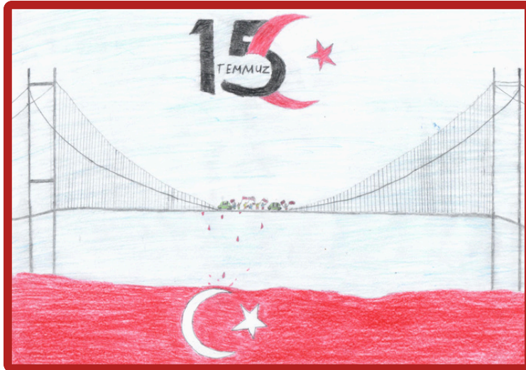
Deniz Mansuroğlu 8/B