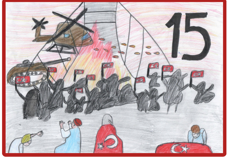
Aylin Gazi 8/B