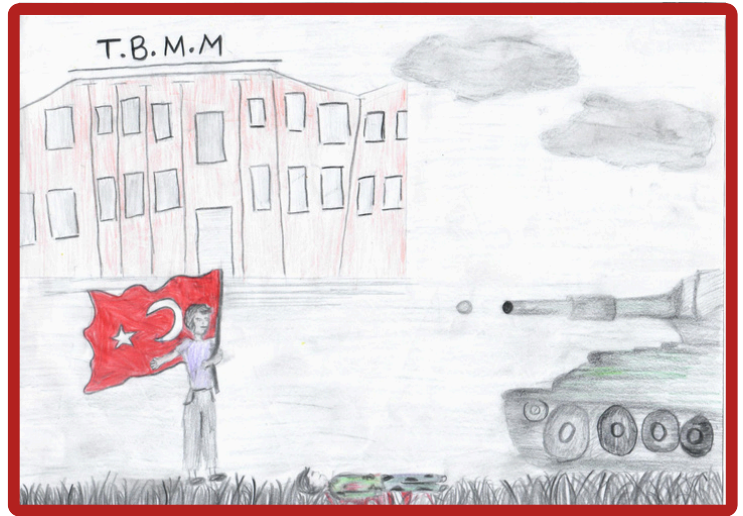
Eda Günay 7/A