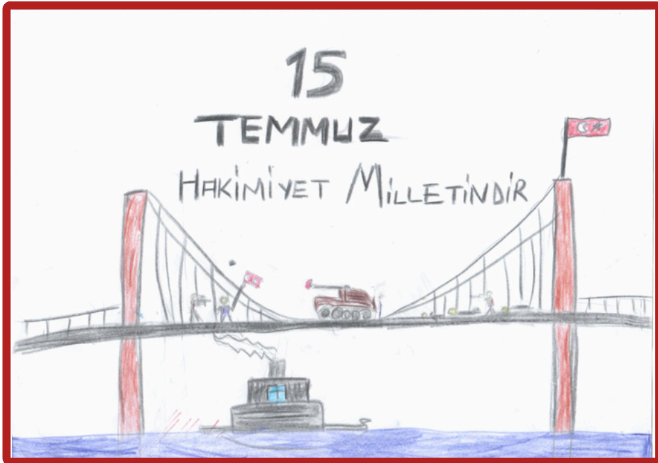
Mert Cemali 7/C